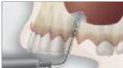
Anheben der Membran

Dank der speziellen feinen IntraLift-Instrumente und dem „hydrodynamischen Kavitationseffekt“ (Bildung kleiner Luftbläschen unter Wasserdruck) durch den Ultraschall wird zeitgleich mit dem Anheben der Membran das Material in die Höhle gestopft und gleichmäßig per Sprühnebel verdichtet – in nur einem kontrollierbaren Schritt!