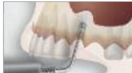
Einbringen des Knochenmaterials

Während mit rotierenden Instrumenten stets die Gefahr besteht, das Gewebe und die Schleimhaut zu verletzen, ermöglichen die fünf neu entwickelten Ultraschallansätze ein einfaches und präzises Präparieren des Zugangs im Implantatbett sowie ein sicheres Ablösen der Membran – ein extrem sanfter Eingriff also (Zugang max. 3 mm groß) ohne Verletzungsrisiko und spätere Komplikationen!